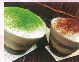
第13回 菓子部門 優勝 「いっほの贅沢ティラミス」