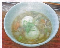
第13回 軽食部門 優勝 「貝たくさん けんちゃん雑煮」

(AB-1コンテストエントリー品目以外の授産品も、物販(授産品販売)コーナーで販売します。)